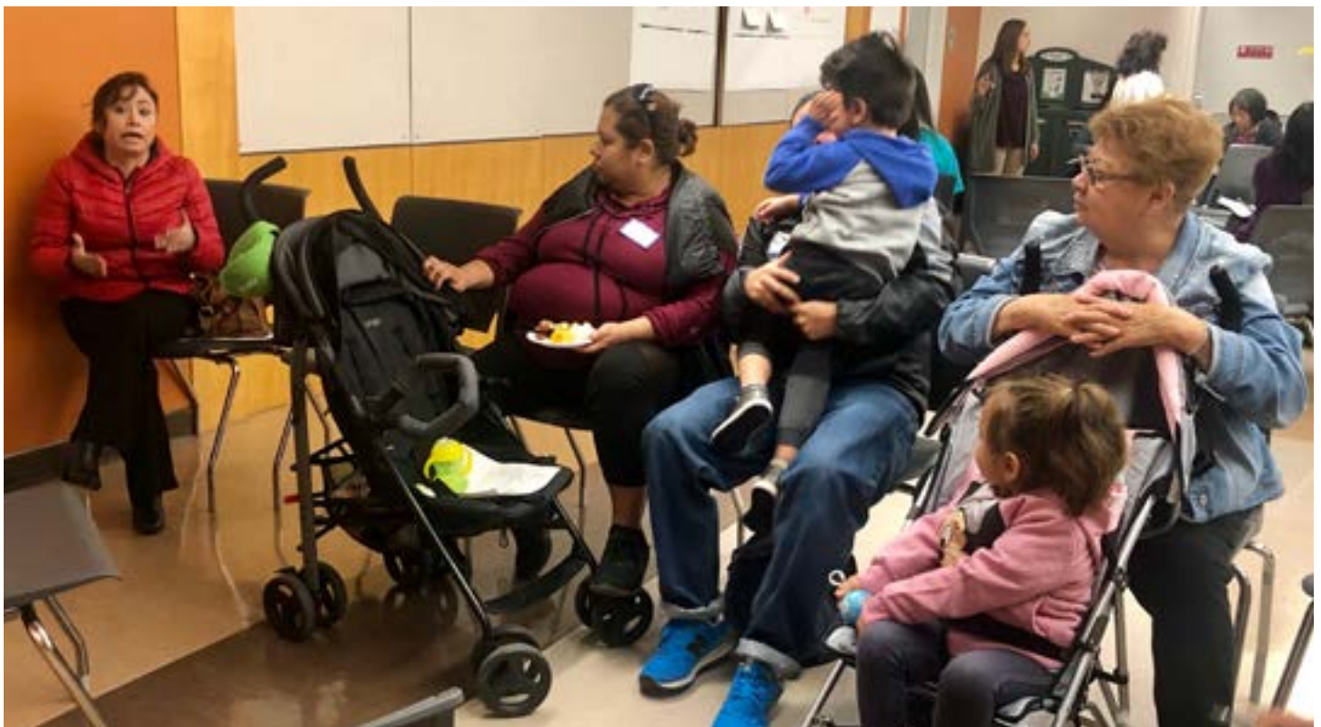
上方和右上：家長和 ECE 教育工作者參與第 1 場社區市政會議。