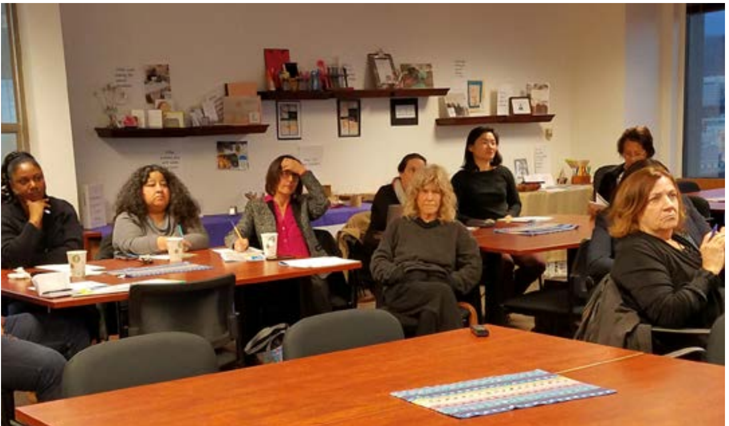
上方：主任和工作人員參與家庭資源中心的意見交流會議。